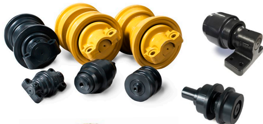
Rullar till grävmaskiner, minigrävare och bandtraktorer är konstruerade för krävande förhållanden. Rullarna är oljefyllda och monterade med smidda duo-cone tätningar av hög kvalitet.