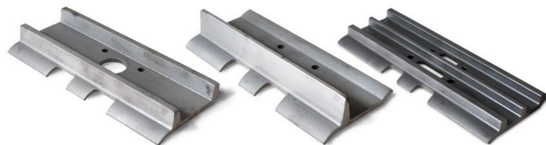
Bandplattor i olika utföranden och tjocklekar.