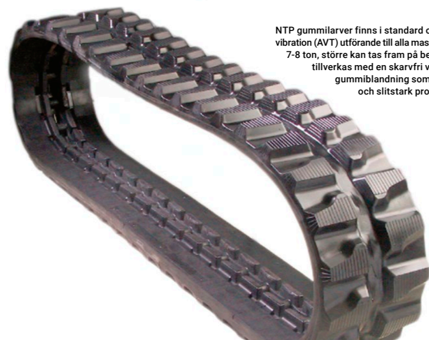
NTP gummilärver finns i standard och anti-vibration (AVT) utförande till alla maskinmärken upp till 7-8 ton, större kan tas fram på beställning. Larverna tillverkas med en skarvfri vajer och med en gummiblandning som resulterar i en säker och slitstark produkt.