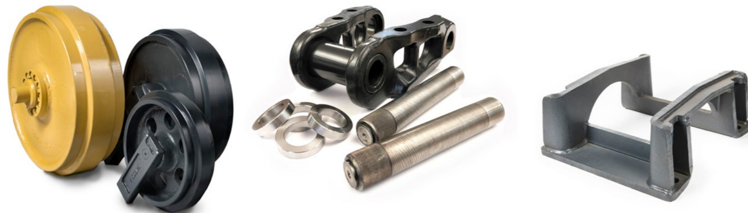
Rullar till grävmaskiner, minigrävare och bandtraktorer är konstruerade för krävande förhållanden. Rullarna är oljefyllda och monterade med smidda duo-cone tätningar av hög kvalitet.