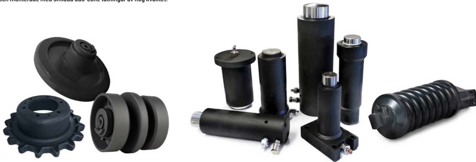
NTP:s underredskomponenter finns tillgängliga för ett brett utbud av banddrivna kompakttastare (CTL).