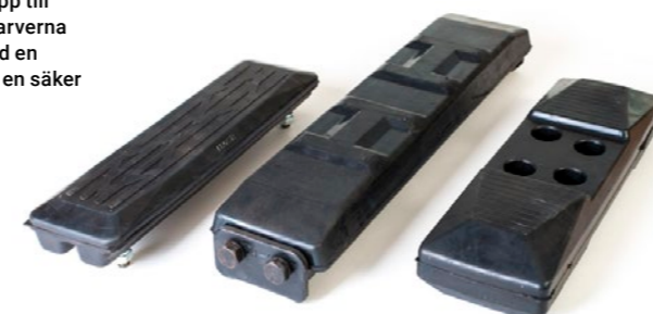
NTP gummipads finns i tre olika utföranden, Chain-on som monteras direkt på kedjan, Clip-on som monteras med ett clips på befintlig platta och Bolt-on som bultas fast på befintlig platta.