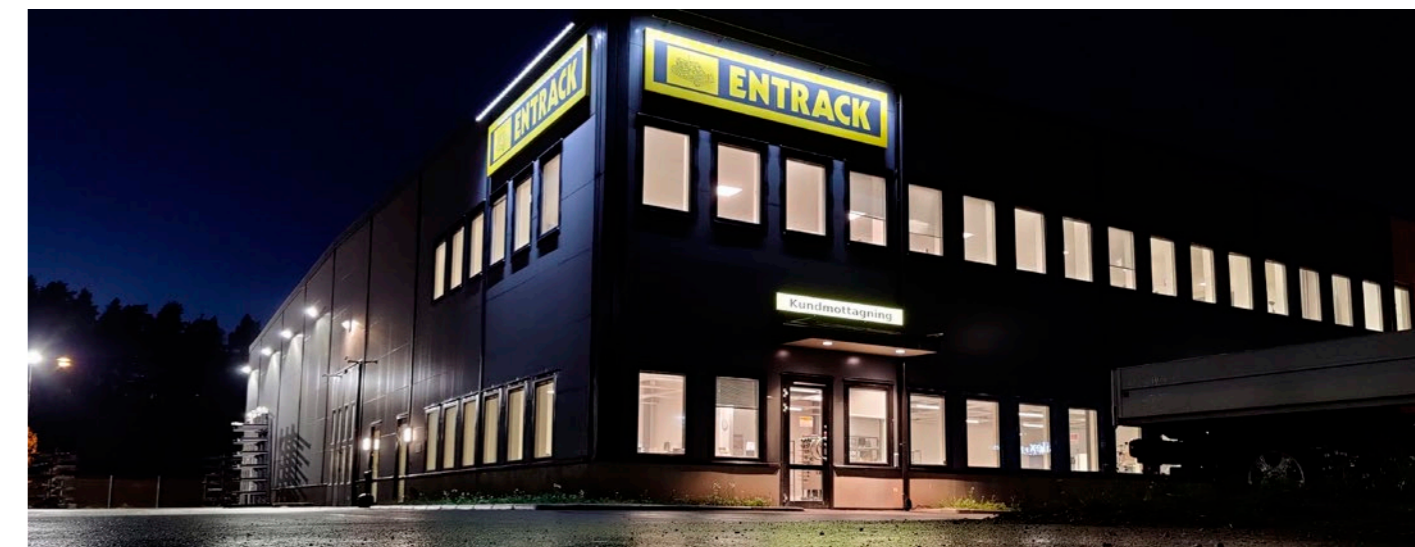
Ett av de bredaste sortimenten och de största lagren av underredskomponenter i Europa.