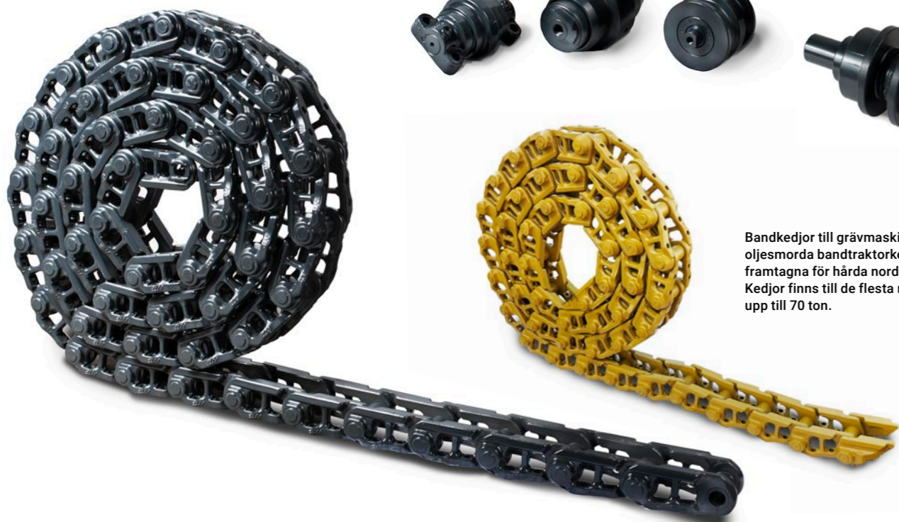
Bandkedjor till grävmaskiner och oljesmorda bandtraktorkedjor är speciellt framtagna för hårda nordiska förhållanden. Kedjor finns till de flesta maskiner med vikt upp till 70 ton.