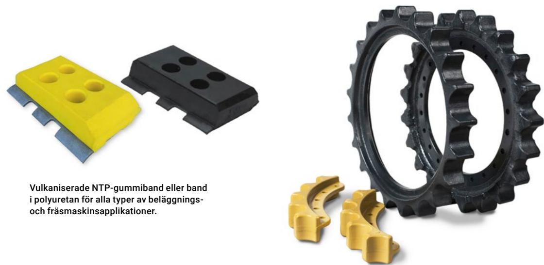
Vulkaniserade NTP-gummiband eller band i polyuretan för alla typer av beläggnings- och fräsmaskinsapplikationer.

NTP är ett resultat av många års samarbete och produktutveckling tillsammans med flera ledande tillverkare av bandvagnsdelar. Vi har med omsorg valt partners där kvalitet, flexibilitet och korta ledtider är viktiga parametrar. Med denna bakgrund så har vi kunnat lansera uppåt 2000 nya produkter de senaste åren. NTP täcker i dagsläget behovet till de flesta märken med en maskinvikt upp till ca 75 ton. Här visas ett urval av våra produkter under varumärket NTP.