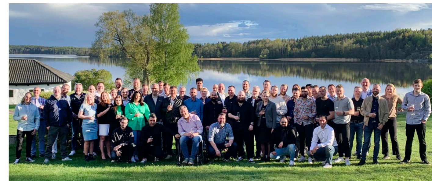
Personal med hög kompetens och lång erfarenhet inom branschen.